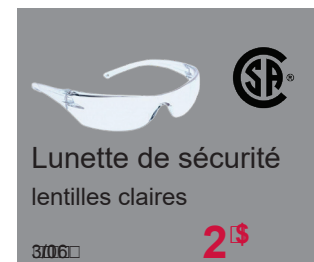
Lunette de sécurité lentilles claires 3706