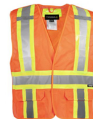
Veste de sécurité détachable en 5 points VES116523OR/XL-S8