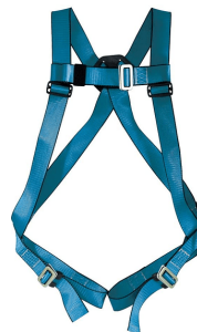
Harnais économique Phoenix FALAC432-S7