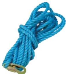
Ligne de vie de 30 pieds FALGS30NK-S7