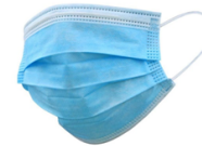
Masque de procédure bte 50 REMAST001-S4