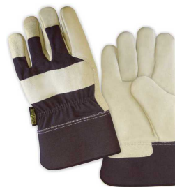
Gant doublé molleton en cuir de porc MGC7410PLCQ-S6