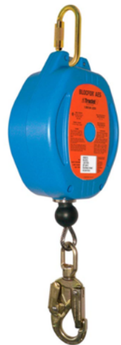
Enrouleur dérouleur de 30 pieds RA30G-S7