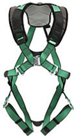
Harnais MSA V-FORM MSA10206101-S7

Formations Protection respiratoire Protection antichute Services Inspection et recertification d'équipement antichute Personnalisation de vêtements